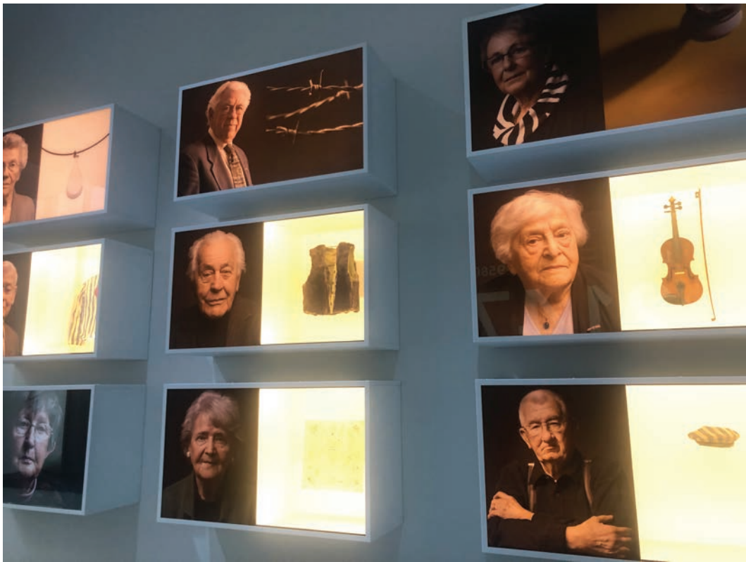
Lichtkasten met portretfoto's van overlevenden van kamp Vught in combinatie met een object in het tentoonstellingsonderdeel 'Ogen van de oorlog'.